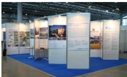
↑ «Острова». Выставка ландшафтных инсталляций. Международный ландшафтный форум в «Гарден Сити» ↑ «Рациональность и искусство архитектуры»