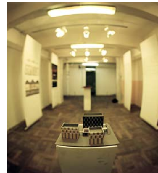
↑ «Альтернативный Петербург» в «Лофт-проекте ЭТАЖИ»