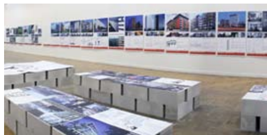
↑ «20 лет финской архитектуры» в Доме архитектора ↑ «Модернизация панельных зданий. Опыт Германии» на II Московской биеннале архитектуры